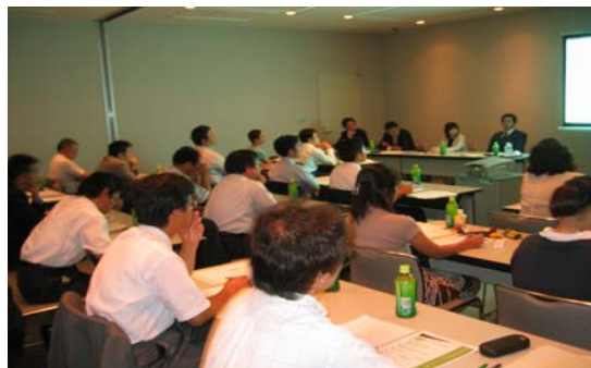
平成 17 年 8 月 24 日開催風景