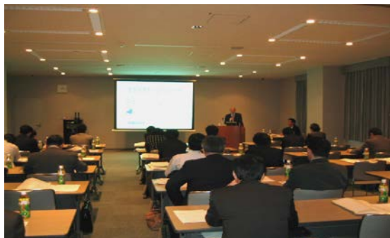
平成 17 年 1 月 28 日開催風景

今後も、こちらのセミナーに関しては、順次開催していく予定ですので、皆様のご参加を宜しくお願い致します。